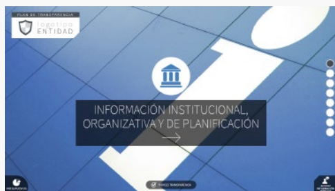
PLANTILLA 1 HOMELANDING

Diferentes opciones de diseño para implementar