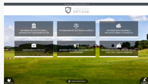
PLANTILLA 3 LANDSCAPE